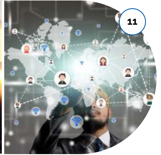
समुदाय और नेटवर्किंग