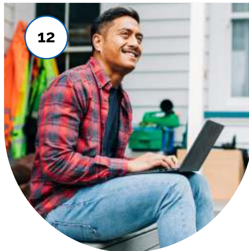
लचीले शिक्षण विकल्प