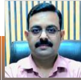
Amiya Sir Facutly - History 6 Years Experience