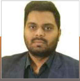
Swaminathan Sir Founder Prepation 7 Years Teaching Experience