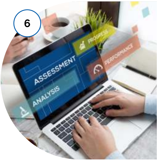
मूल्यांकन और प्रतिक्रिया