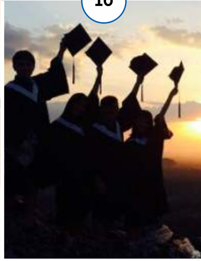
पूर्व छात्रों की सफलता की कहानियाँ