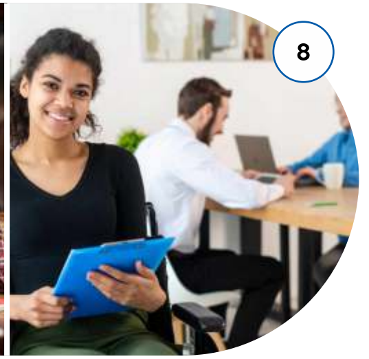
करियर परामर्श और मार्गदर्शन