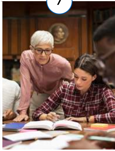
छात्र सहायता और मार्गदर्शन